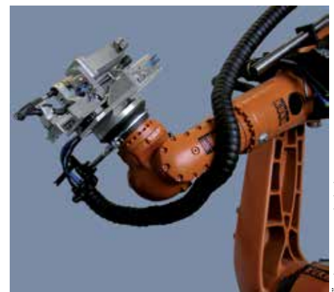
Roboterassistiertes Schraubsystem der Firma Weber Schraubautomaten