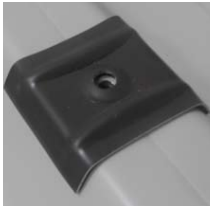
Kalotte für Trapezprofil